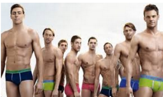
Avec l'aide du SNITPECT

Encore la métaphore du bateau ... j'espère que vous êtes tous de bons nageurs. Dans tous les cas le SNITPECT-FO est là pour vous aider !