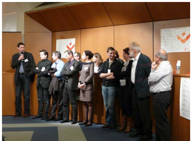
PHOTOS DU CONGRES 16-17 DECEMBRE 2010