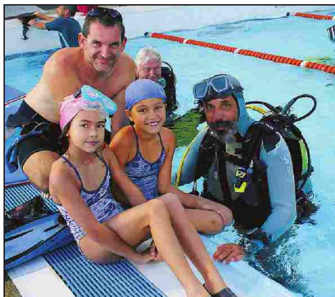
Les enfants ont découvert la plongée dans la piscine des Avirons, avant, qui sait, d'évoluer un jour dans le Grand bleu.