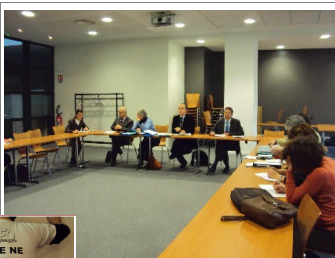
Le SG, entouré par l'administration