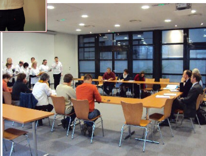
Lecture FORCE OUVRIERE